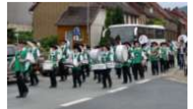
Musik i Wolfshagen

Jeg fortsætter op gennem skoven Mispliet, ned ad en stejl skovvej og forbi en gabende tom sportsplads, men det er der en forklaring på. Nede i byen står folk afventende. Jeg synes, jeg kan høre trompeter i det fjerne, så jeg venter med. Lidt senere kommer hele tre orkestre marcherende: et grønt/sort, et sort, et rødt og et grønt/hvidt, som efter bedste evne forsøger at spille samme melodi. Det lokale »Fanfaren- und Muzikzug« som i år fejrer 50-ars jubilæum, er i spidsen. Da de er forbi, fortsætter jeg op forbi Wolfshäger Festhalle, hvor der gjort klar til sommerfest. Jeg kan stadig høre musikken. Ruten fortsætter ad en panoramavej i skovbrynet vest om byen. Her er også en fin Lehrpfad med skilte i voksen- og børnehøjde og en del bænke opsat af Harzklub Zweigverein Wolfshagen, som også er mester for den store tavle med den versificerede opfordring til at besøge byen. Den står nede ved Innerstestausee, hvor turen slutter for denne gang.