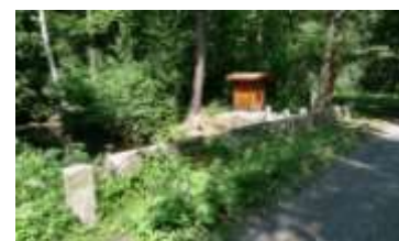
Delstatsgrænsen i Eckertal