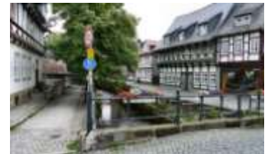
Floden Abzucht i Goslar

Jeg følger stien langs banen og lige før vejen ned til Herzog Juliushütte drejer jeg op ad asfaltvejen til Granestausee og går over dæmningen. Her er en fin udsigt mod øst og en række informationstavler, der fortæller om denne og de andre opdæmmede søer. Granestausee anvendes til drikkevand og der er flere skilte videre frem, der advarer mod at gå for nær.